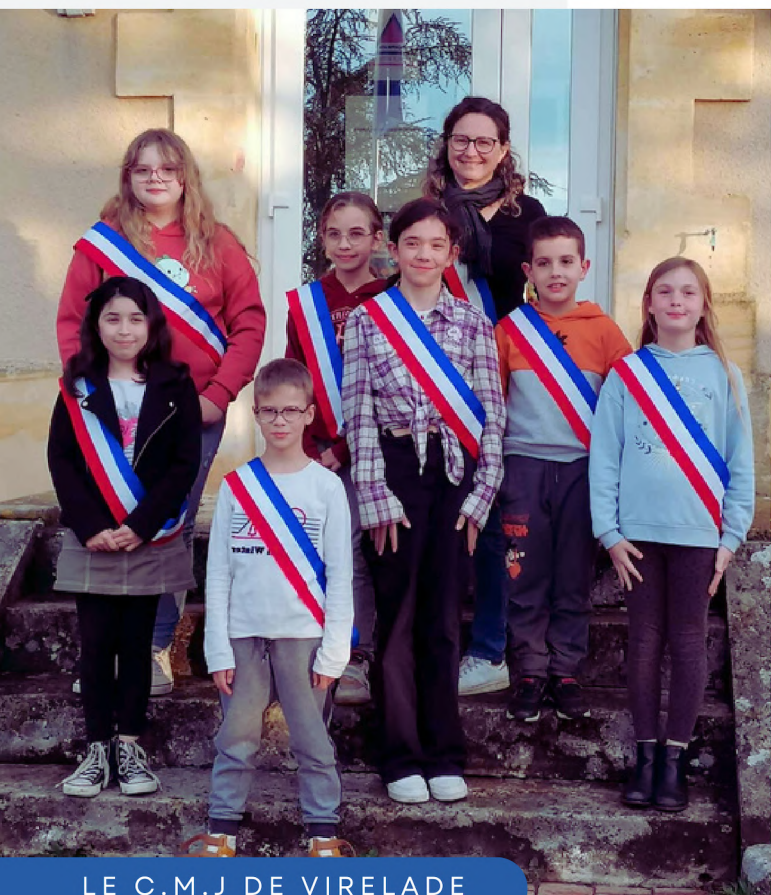
LE C.M.J DE VIRELADE

Vous serez bien sûr informés de l'avancée des travaux et de la date d'activation de cette extinction partielle.