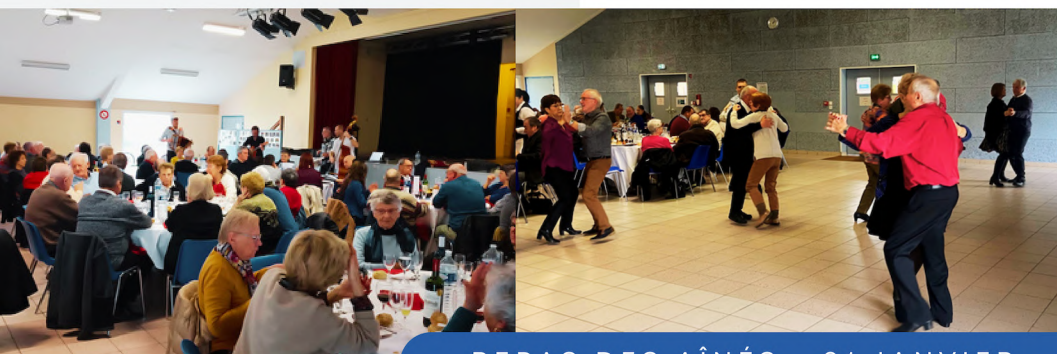
REPAS DES AÎNÉS - 21 JANVIER